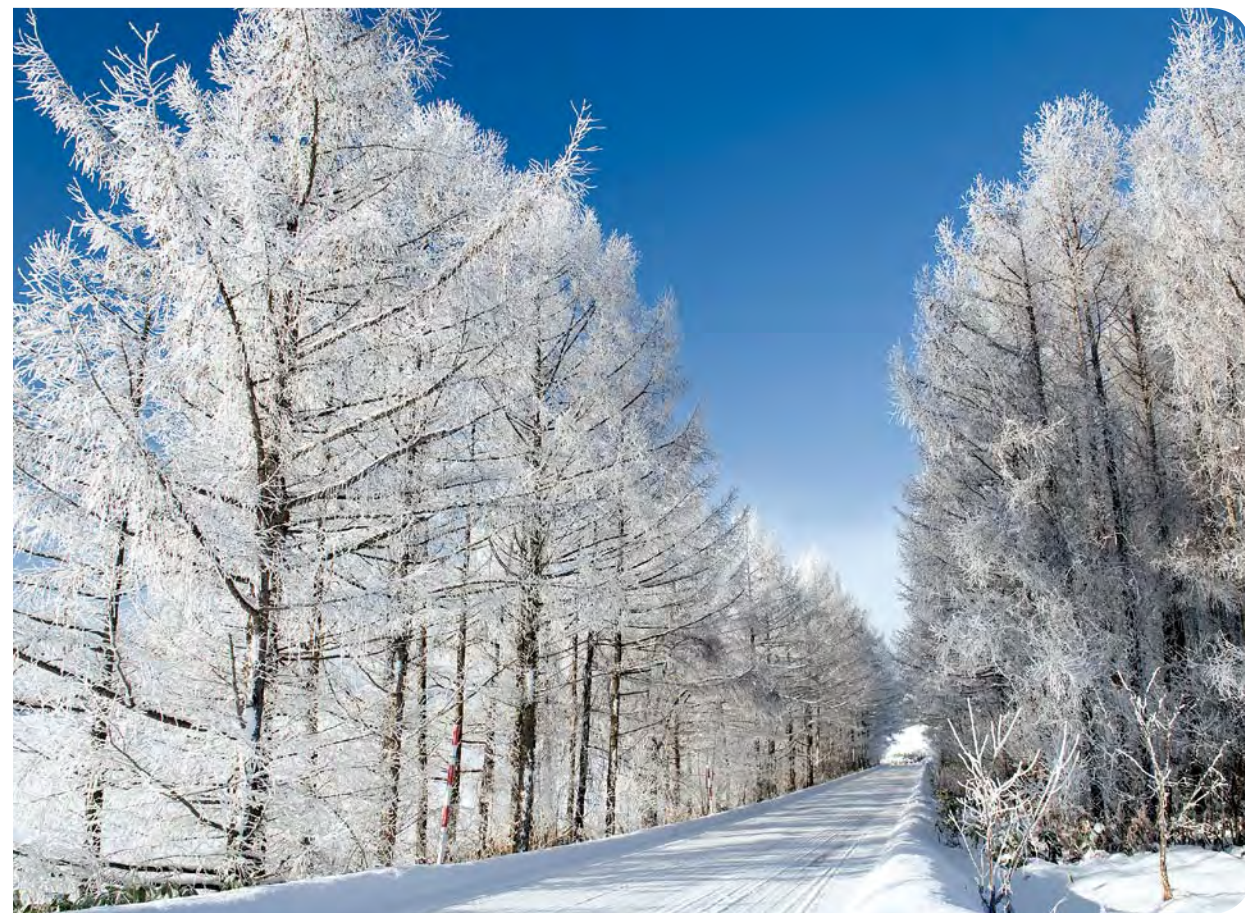
北海道 美瑛町 樹氷の丘