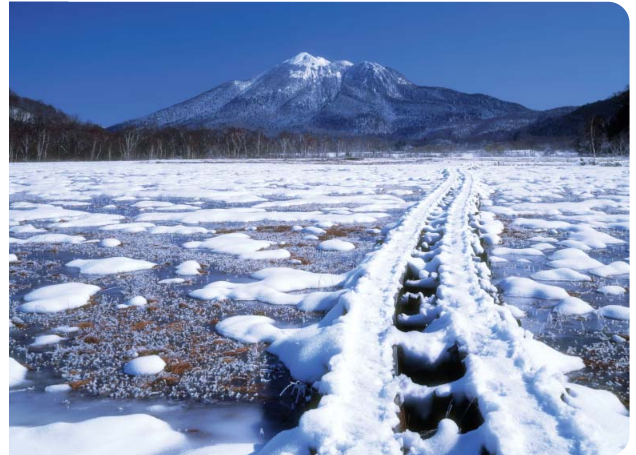
福島県 尾瀬ヶ原と燧ヶ岳

監修 岩本安彦 (東京女子医科大学糖尿病センター センター長) 編集協力 岩崎直子 内湯安子 尾形真規子 北野滋彦 佐倉宏 佐藤麻子 佐中真由実 新城孝道 中神朋子 馬場園哲也 (東京女子医科大学糖尿病センター) アイウエオ順